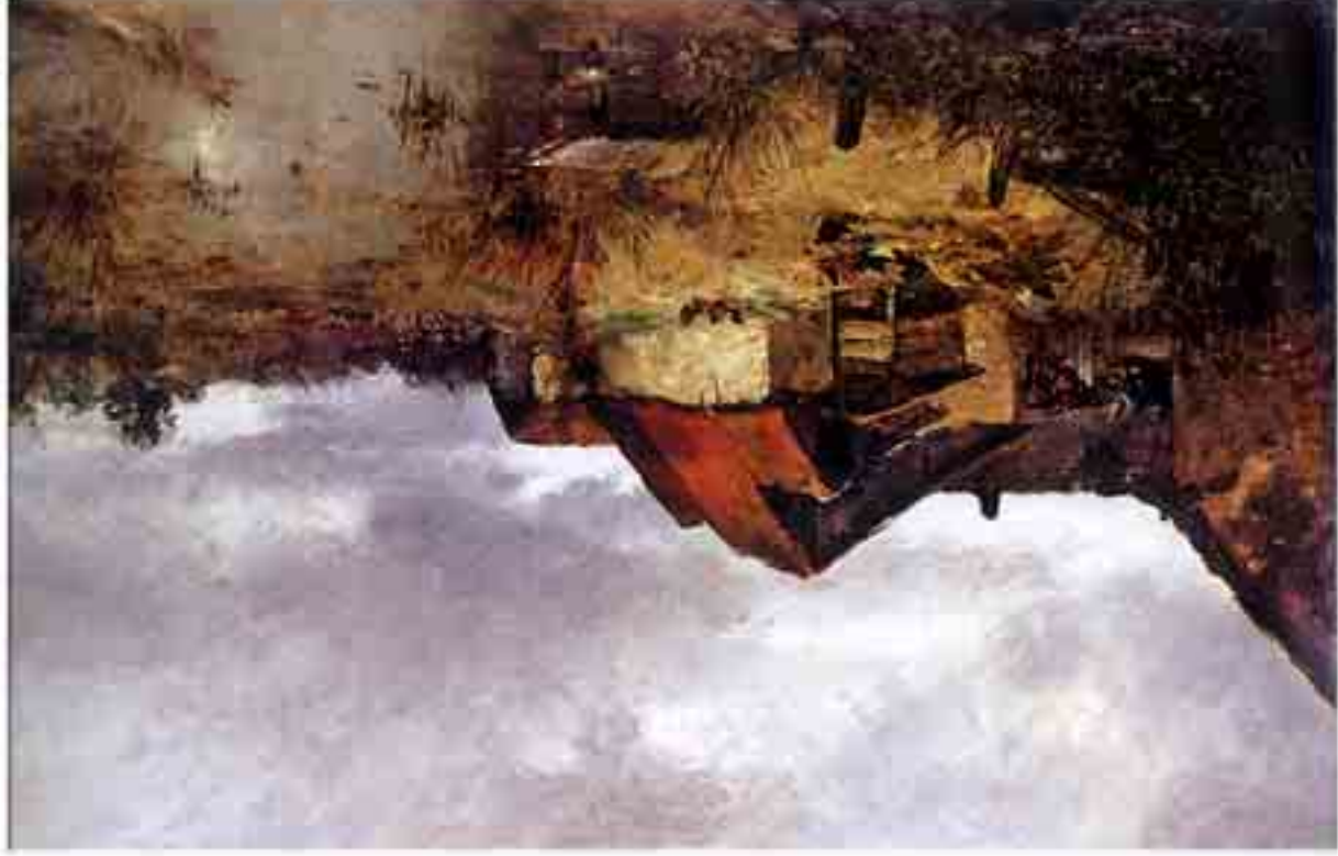
Charles Jacques: A legelőn, 1875 81 x 65, olaj, vászon, Sz. M. Budapest