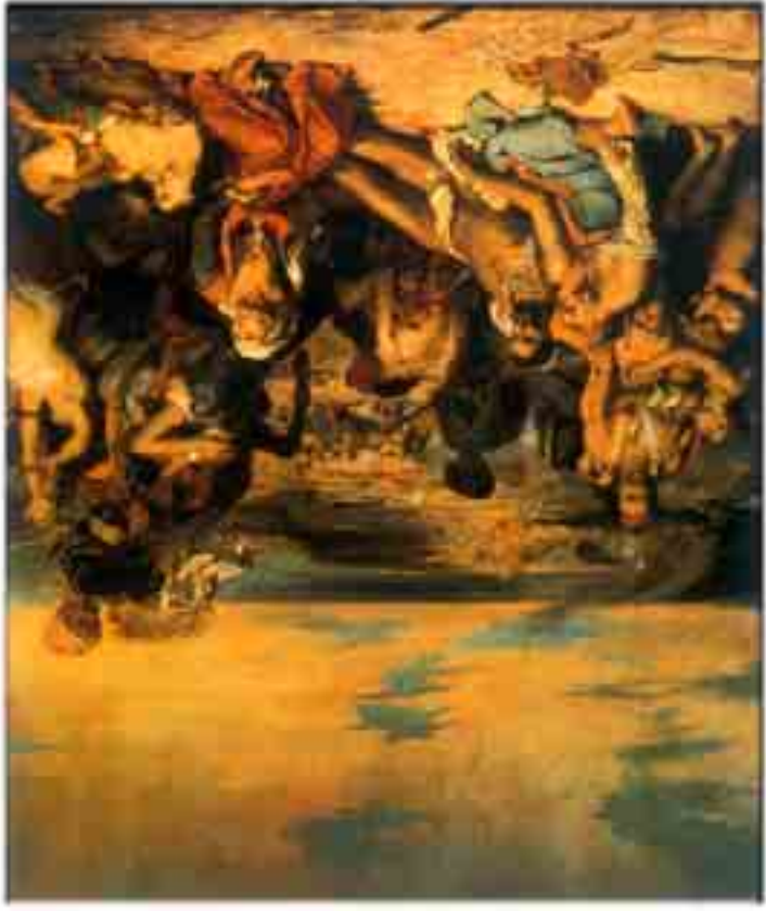
Eugene Delacroix: Chiosis mészárlás 1824, olaj, vászon

állítja a legnagyobb francia romantikus. Még csak 1822-t írunk. Alig két évvel később a Chiosis mészárlás-t – John Constable a Szalonban kitállított Szénásszeker című képét meglátva, hitetlen úgy érzi, a saját munkájának gyenge a háttere, ezért – három vagy inkább négy nap alatt át-festi. Sminkel. Valóban azt mondhatjuk, bizonyos értelemben, hogy fiatalít a képen, ha egy vérengzést ábrázolva nem is finom és pontos ez a szóhasználat.