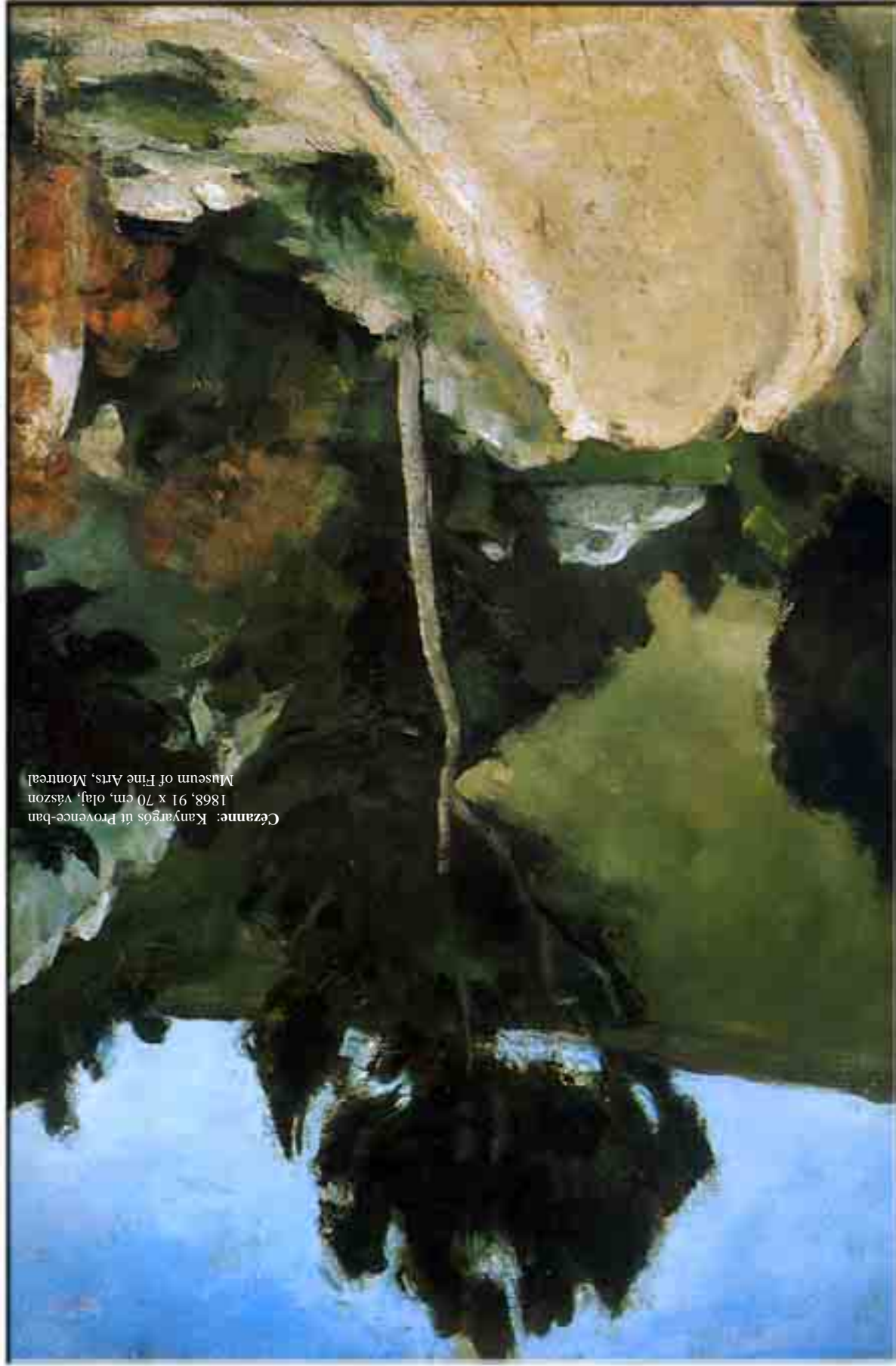
Cézanne: Kanyargós út Provence-ban 1868, 91 x 70 cm, olaj, vászon Museum of Fine Arts, Montreal