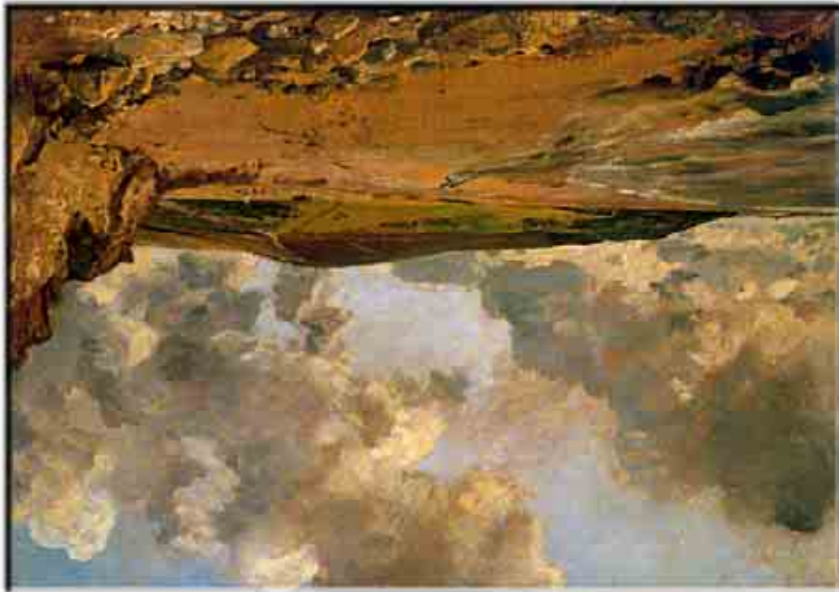
John Constable: Weymouth-öböl 1816. olaj

Delacroix: Villámhátsó megretent 16* 1824, 23,6 x 32 cm, aquarelle Szépművészeti Múzeum, Budapest *Erről a kisméretű aquarelléről azt írja Genthon István 1964-ben, hogy ez a fiatal Delacroix egyik fő műve. Igaz, ekkor már túl van a Dante és Vergilius pokoloraszállya -sán és épp kiállítja a Chiosz mérszáhszt , de ez a munka valóban a romantika egyik lehetséges leg-szebb megjelentése a papíron.