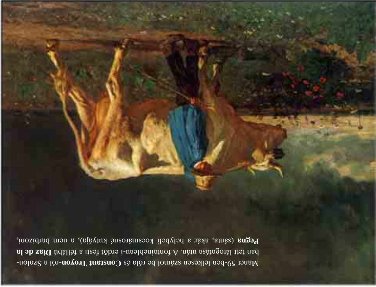
Manet 59-ben lelkesen számol be róla és Constant Troyon -ról a Szalon-ban tett látogatása után. A Fontainebleau-i erdőt festi a féllábu Diaz de la Pégna (sánta, akár a helybeli kocsmárosné kutyája), a nem barbizoni,

Constant Troyon: Téhnápasztor, 1860 77 x 103, olaj, vászon Szépművészeti Múzeum, Budapest