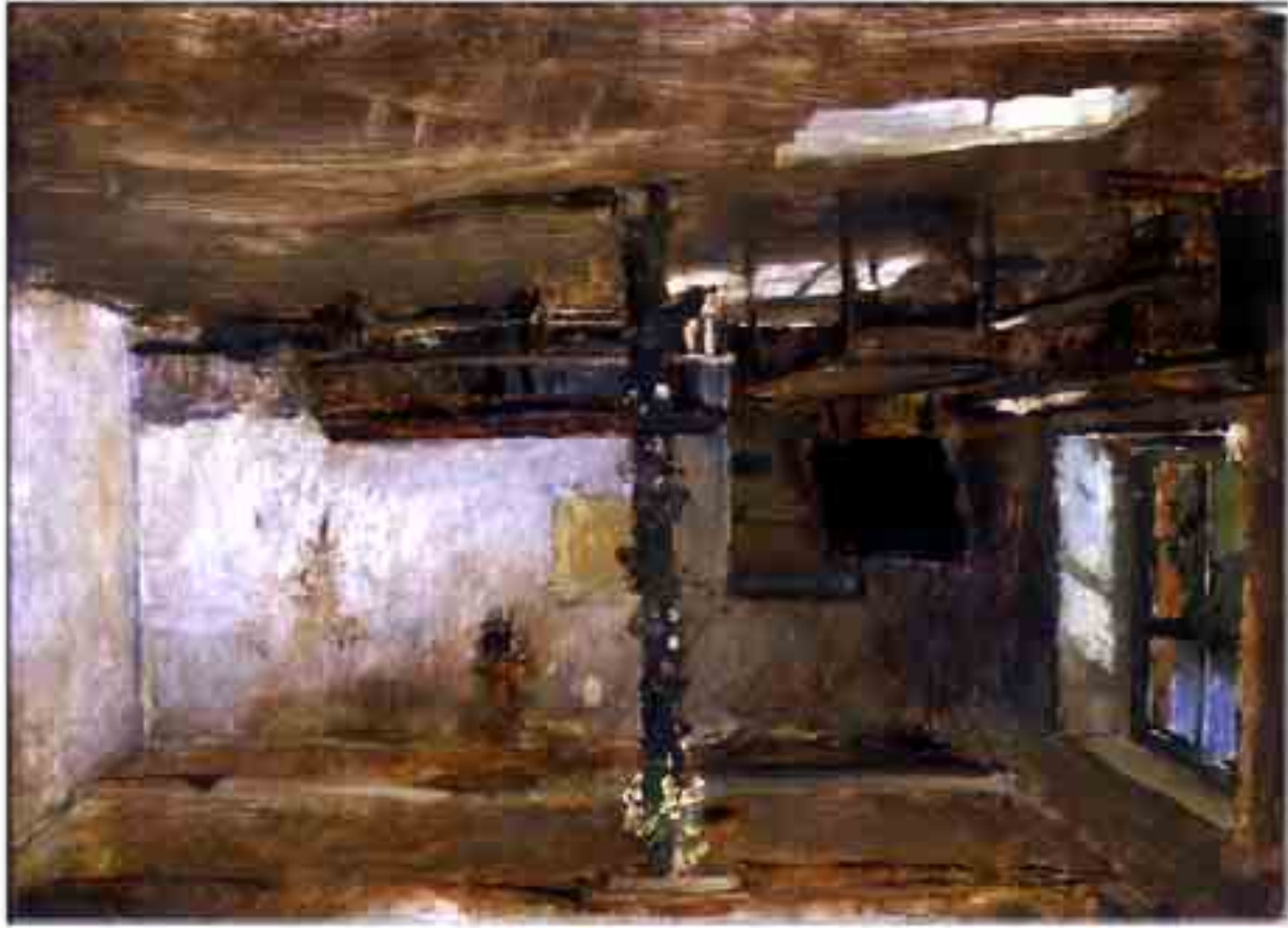
Munkácsy Mihály: Tanulmány (tanulmány) a Colpachi iskola című képhez 1882. 42 x 58 cm, olaj, vászon

*szerepvállalásával és Manet elleni kitrésével kapcsolatban azért a kép ányaláb . Jó barátságot tart fenn például azzal a Ribot-val, aki a Manet Galériában kiállít Manet-batignolles-i csoport fejének, és az egyben nagy tisztelője is a val és egyben nagy tisztelője is a megkövetelt kidolgozás aztán elfed. Sajnos, benne a sikerre áhító ember lefojtja az isteni hangot. A kortzis irányába való hajlékonyságának okát a gyerekkori nyomorúságban találjuk meg, ropant nagy tehetsége nem az újítóé, hanem az emlékek öröjé, kitakadásai – főleg Manet ellen – ebből a különbözöségből erednek. Rossz pillanatában mond olyat is, hogy azért szeretne szerepet vállalni a magyar kultúrában*, hogy az impresszionisták hatását itthon gátolhassa. Amíg a közizlésnek megfelelő pepecselés nem hűz függőnyt az egy lendülettel fölrakott formák fölé, addig az ember szellemi rendjének tévedhetetlenül biztosan megrajzolt szerkezete világlik ki minden vázlatán. A világ rendje ez. A világ világít megjeleno mélységes lényegre, ez a képzművészetben közvellenül értel-mezhető tételnek tűnik. Van és lehet hitele akkor is a vásznon létrehozott világnak, ha nem utat tör, hanem az út mellett hazát épít. Goethe* szerint az igazán tehetséges alkotónál a mű minden fázisában kész. A kevesebb a