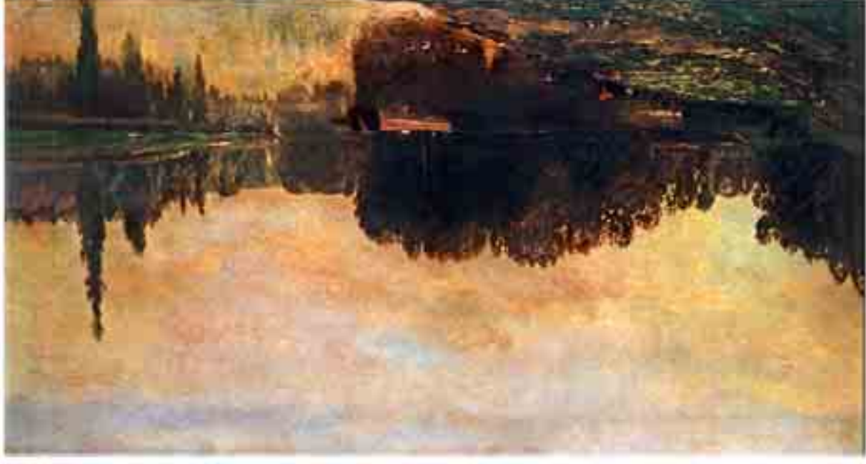
Daubigny: Az Oise folyón, 1851 26,5 x 35 cm, olaj, fa, Szépművészeti Múzeum, Budapest

Jön az igazi keveredés. Rövid idejű irányzatok, hatásuk mégis túlnő az időtartamban többet mutató elődöknel. Leginkább az impresszionizmusra igaz ez. Felborít minden addigi fáradságot, körmölést, elvet minden részletezést. Szinte egy időben, mégis előzményként jegyezhető a barbizoniak megjelenése.