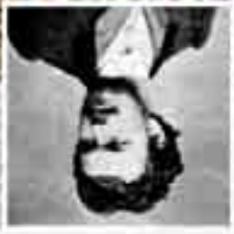
Munkácsy Mihály 22 évesen

Munkácsy Mihály: Röszehordó nő 1873, 99,7 x 80,3 cm, olaj, vászon Magyar Nemzeti Galéria