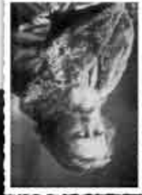
Zichy Mihály 1877 körüli fotója

* ZICHY Mihály (1827-1906) magyar festő, grafikus. Előtérnek nagy részben Csozoroszában dolgozott cári festőként. Párizsban hat évet töltött a Magyar Társulat elnökeként. Arany balladáihoz és Madách Ember Tragédiájához készített illusztrációban éri el művészetének csúcspontját.