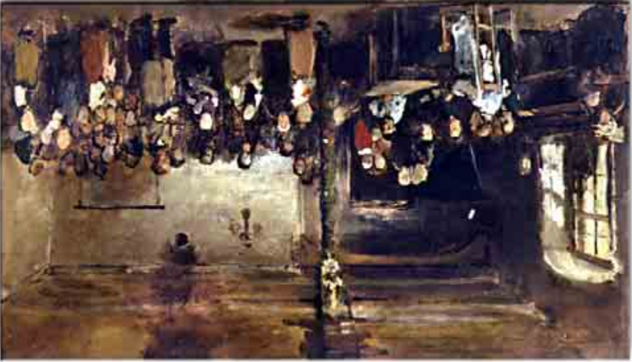
Munkácsy Mihály: Colpachi iskola vázlat, 1882. 63 x 110,3 cm, olaj, vászon Magyar Nemzeti Galéria

Munkácsy Colpachi iskolához készült vázlatának részlete