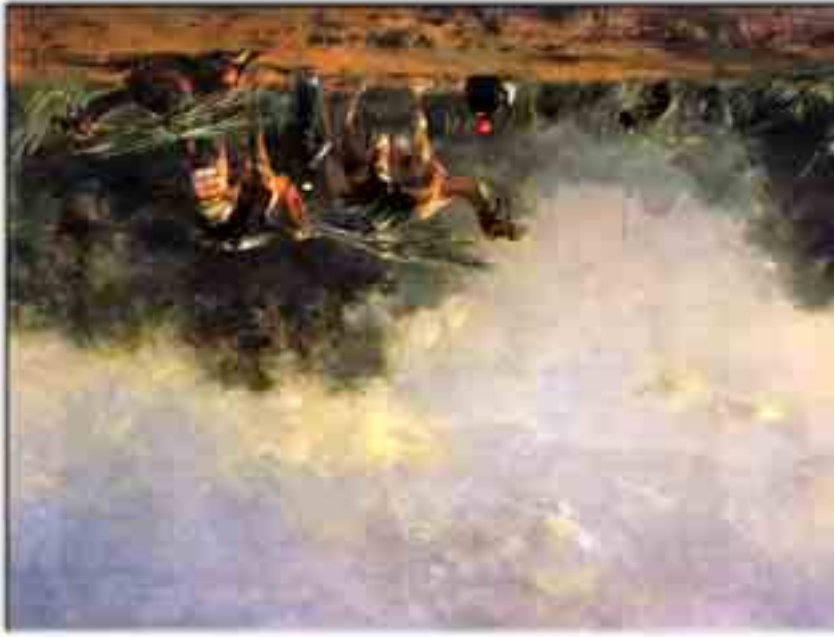
Fromentin: Nádvágók a Niluson, 1871 26,5 x 35 cm, olaj, fa Szépművészeti Múzeum, Budapest

* az AFRIKAI KONTINENS iránti érdeklődést I. Napoleon 1798-as egyiptomi hadjárata közben felkeltette, kikben fókuszta, de a francia hadak Algériáért folytatott gyarmatosító háború már az ország fe-nyegében minden lakosának fi-gyelmét magukra vonták.