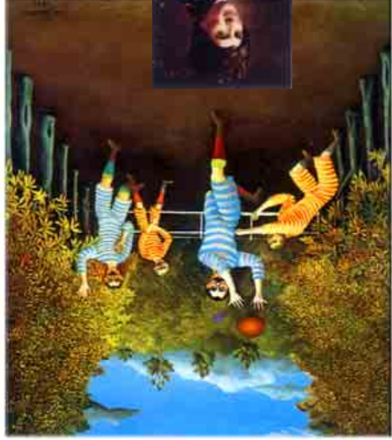
Vámos Rousseau: Labdajáték, 1908 100 x 80, olaj, vászon Guggenheim Museum

ROUSSEAU, Jean-Jacques (1712-1778) francia író, filozófus. Egy meg nem értett autodidakta vándor, aki akarta vezetni a természetet vissza országot. Az emberiséget vissza-genti lévén – allig ismerle Francia-ember megrontott állat"- vallotta.