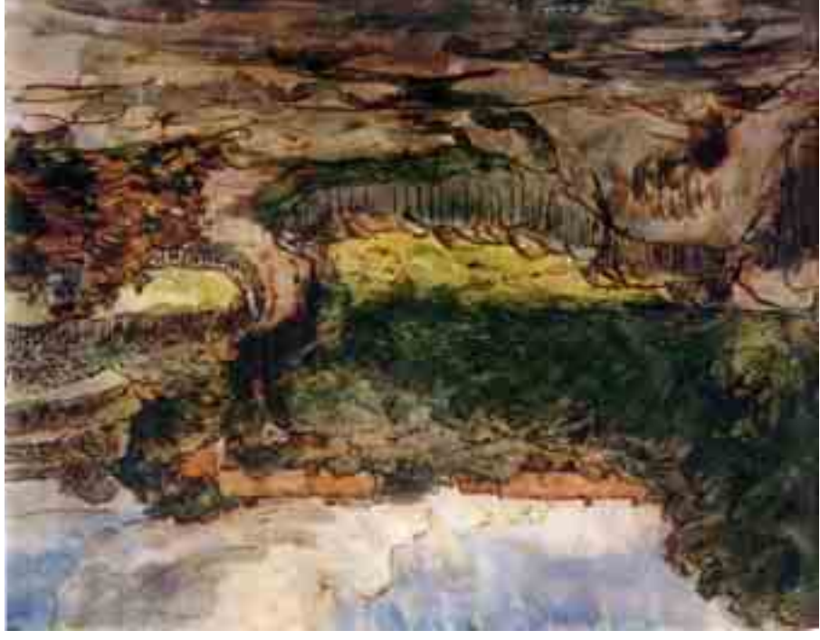
Jean-Francois Millet: A Cousin-tanya Greville-ben, 1854 22,5 x 28,2 cm, aquarelle, tus Szépművészeti Múzeum, Budapest

* ZICHY Mihály (1827-1906) magyar festő, grafikus. Előtérnek nagy részben Csozoroszában dolgozott cári festőként. Párizsban hat évet töltött a Magyar Társulat elnökeként. Arany balladáihoz és Madách Ember Tragédiájához készített illusztrációban éri el művészetének csúcspontját.