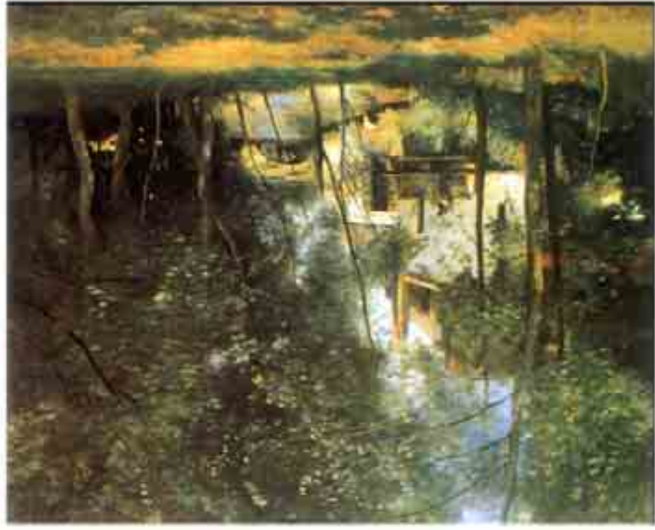
Camille Corot: Malom Saint-Nicolas-les-Arras-ban 1874, 65,5 x 81 cm, olaj, vászon Musée d'Orsay, Párizs