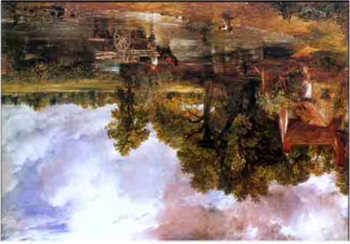
John Constable: Szénásszeker 1823, olaj

állítja a legnagyobb francia romantikus. Még csak 1822-t írunk. Alig két évvel később a Chiosis mészárlás-t – John Constable a Szalonban kitállított Szénásszeker című képét meglátva, hitetlen úgy érzi, a saját munkájának gyenge a háttere, ezért – három vagy inkább négy nap alatt át-festi. Sminkel. Valóban azt mondhatjuk, bizonyos értelemben, hogy fiatalít a képen, ha egy vérengzést ábrázolva nem is finom és pontos ez a szóhasználat.