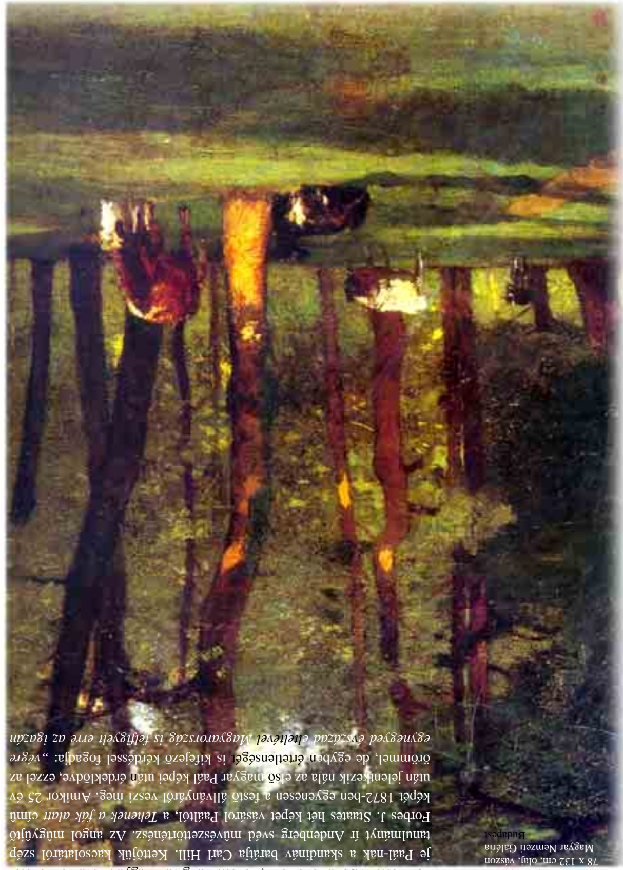
Pál László: Tehenek a fák alatt (réslet) 1872 78 x 132 cm, olaj, vászon Magyar Nemzeti Galéria Budapest