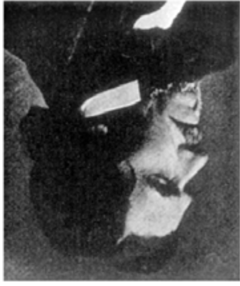
Eugene Delacroix: Dante és Vergilius pokolra szállása 1822, 180 x 240 cm, olaj, vászon