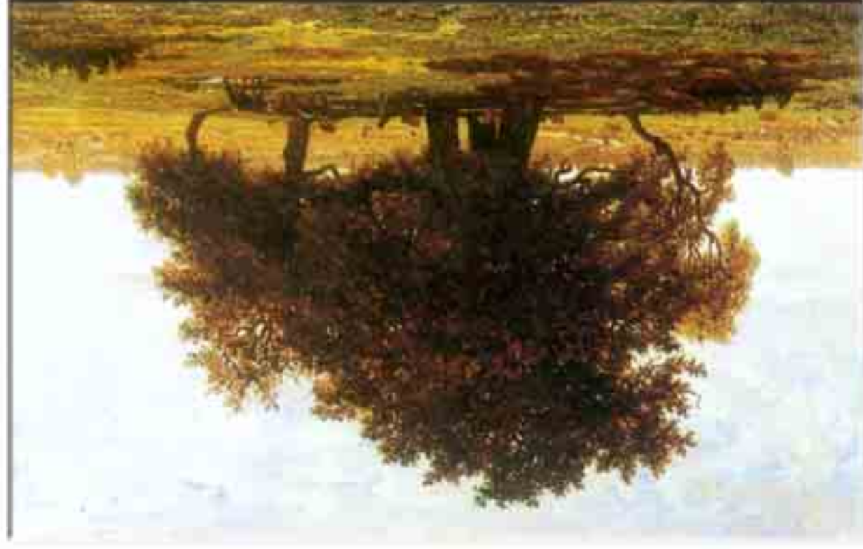
Théodore Rousseau: Tölgyek Aprémont- ban, 1852, 63,5 x 99,5 cm, olaj, vászon Louvre, Paris

Jön az igazi keveredés. Rövid idejű irányzatok, hatásuk mégis túlnő az időtartamban többet mutató elődöknel. Leginkább az impresszionizmusra igaz ez. Felborít minden addigi fáradságot, körmölést, elvet minden részletezést. Szinte egy időben, mégis előzményként jegyezhető a barbizoniak megjelenése.