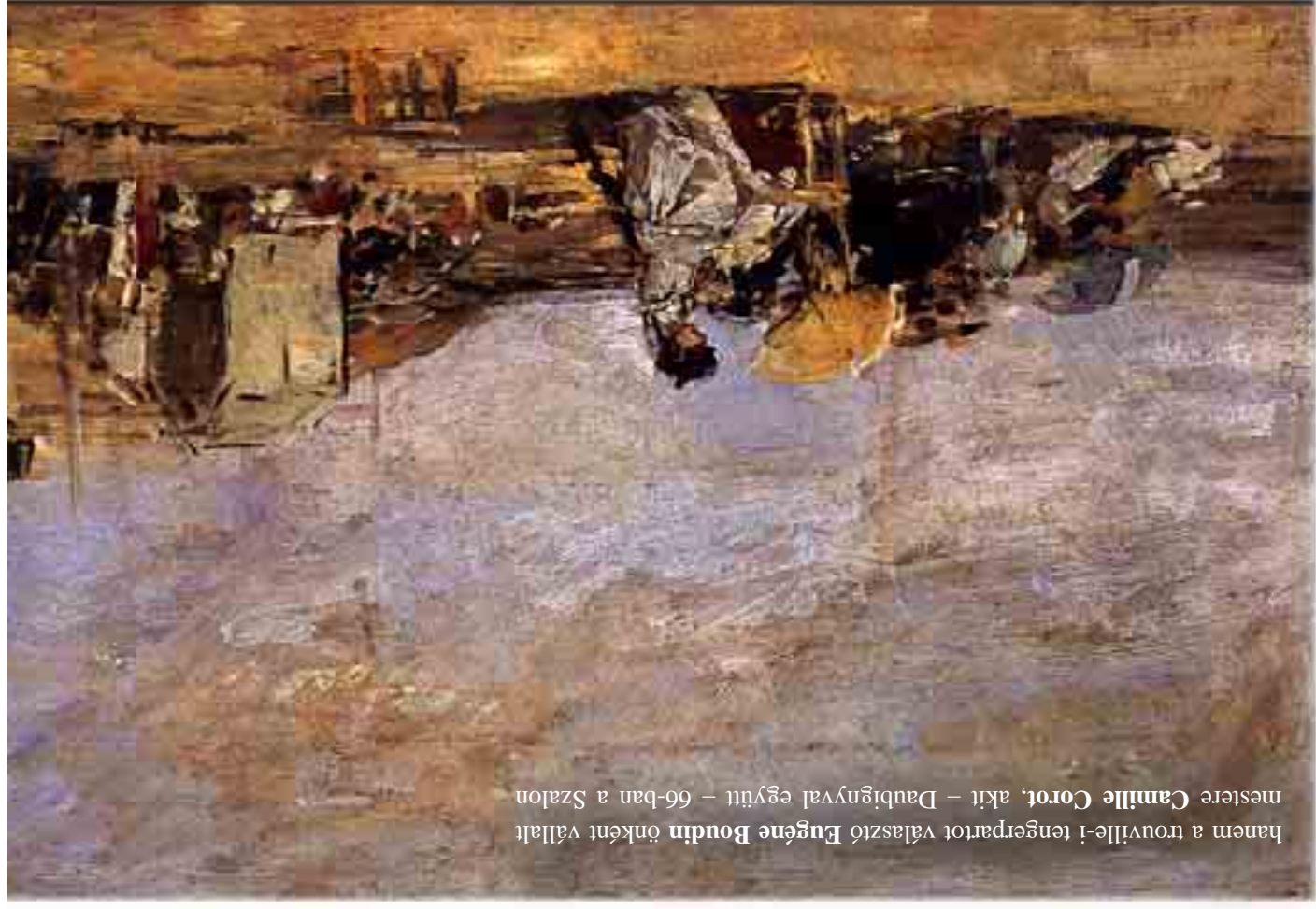
hanem a trovville-i tengerpártot választó Eugène Boudin önként vállalt mestere Camille Corot , akit – Daubignyval együtt – 66-ban a Szalon